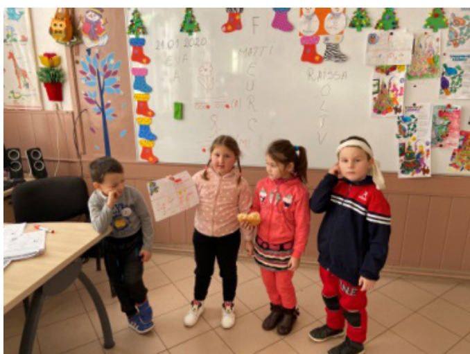
Echipa Skye –literele E,U,R,C