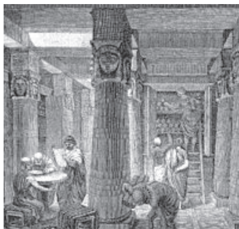
Biblioteca din Alexandria

Cea mai renumită bibliotecă a Antichității este bibliotecă din Alexandria, care conținea peste 900.000 de pergamente, fondată de Ptolemeu I Soter în 288 î.Hr. Această "bibliotecă universală" a făcut din Alexandria capitala cunoașterii. Colecțiile adunate au constituit baza lucrărilor științifice sau teologice, aici s-au născut biblioteconomia, catalografia și critica de text. Cel mai cunoscut bibliotecar din Alexandria este poetul Calimah (sec. III î.Hr.), autor al unui catalog sistematic de literatură greacă în 120 de volume.