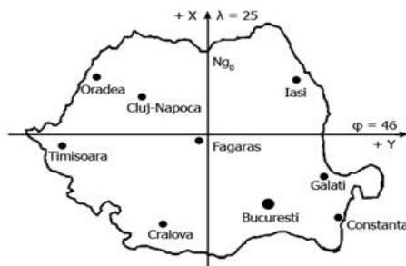
fig. 1.2 Sistem general de axe

Competența derivată. Pe parcursul acestei situații de învățare elevii ar trebui să fie capabili să precizeze care este cea mai importantă paralelă ce traversează centrul României și ce localitate se află cel mai aproape de centrul țării.